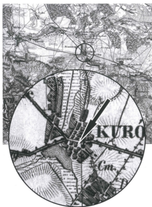
Fragment mapy sztabowej z 1932 r.

Mapy historyczne obrazujące zabudowania w centrum miasta: