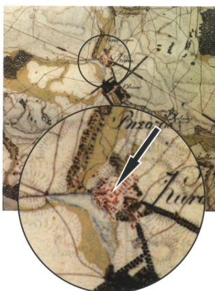
Fragment mapy tzw. Kwaternistrzostwa z lat 1830–ych.