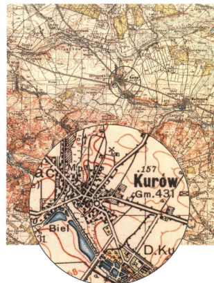
Fragment mapy S. Heldensfelda z 1801 r.